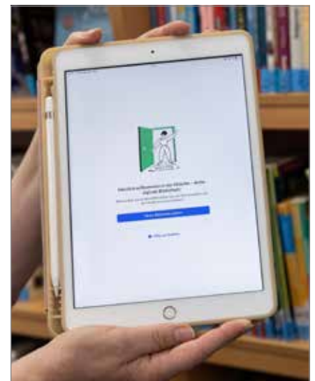
Die Onleihe 3 startet am 10. Juni.

Das Prinzip der Onleihe bleibt dabei unverändert. Digitale Medien werden wie in einer klassischen Bibliothek ausgeliehen und stehen für einen festgelegten Zeitraum zur Verfügung. Die Rückgabe erfolgt automatisch am Ende der Leihfrist. Die neue Onleihe-App (Onleihe 3) kann kostenlos auf Smartphones und Tablets mit den Betriebssystemen Android und iOS in den App Stores heruntergeladen werden. Nutzer, die die Onleihe mit einem PC, Laptop oder E-Reader nutzen möchten, gelangen über die Webseite meine.onleihe.de zu einer zentralen Bibliotheksauswahl mit anschließender Anmeldemöglichkeit. Bestehende Ausleihen, Merklisten sowie die Zugangsdaten werden automatisch in das neue System übernommen.