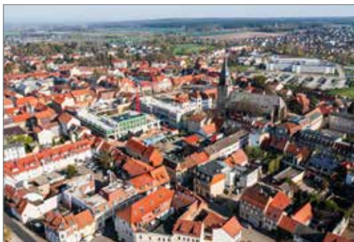
Blick auf die Haldensleber Altstadt

Mit der Kampagne „Altstadt Haldensleben – Dämm Mal Drüber Nach!“ möchte