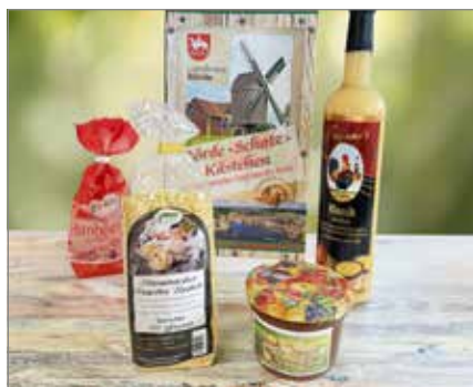
Das Börde-Schatz-Kästchen erfreut mit Köstlichkeiten aus der Region.

Die Börde-Schatz-Kisten erfreuen sich wachsender Beliebtheit und sind als größere Geschenkvarianten über den Online-Shop der Lebenshilfe Ostfalen erhältlich.