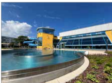
Das Rolli-Bad eröffnet die Freibad-Saison.

Die Stadtwerke Haldensleben geben den Beginn der diesjährigen Freibad-Saison sowie die Sommeröffnungszeiten des Rolli-Bades bekannt. Ab 1. Mai heißt es wieder draußen baden und entspannen. Mit steigenden Temperaturen und passend zum langen Mai-Wochenende öffnet das Rolli-Bad in Haldensleben seinen Außenbereich. Besucher können sich auf die Liegewiese sowie das angenehm temperierte Außenbecken mit rund 24°C freuen. Damit steht einem erfrischenden Start in die warme Jahreszeit für Jung und Alt nichts im Wege.