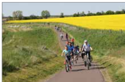
Per Rad gibt es viel zu entdecken.

Im Anschluss kann sich noch bis 17:00 Uhr auf dem Zieglerfest vergnügt werden, zum Beispiel bei einer Führung oder einer Runde mit der Feldbahn.