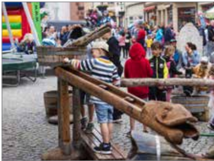
Wasserspaß beim Kinderfest

Auf der Hagenstraße sowie dem Hagen- und Postplatz stehen am Sonntag, 7. Juni, beim großen Kinderfest von 10:00 bis 17:00 Uhr wieder die Jüngsten im Mittelpunkt. Die Abteilung Jugend und Sport der Stadt Haldensleben hat jede Menge Spiel und Spaß organisiert.