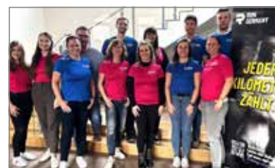
Das SWH-Team – gemeinsam läuft es besser.

Unter dem Motto „Jeder Kilometer zählt“ beteiligen sich die Stadtwerke Haldensleben (SWH) bei Run Germany - Deutschlands größter digitaler Lauf- und Walking-Challenge für Unternehmen. Ziel der Aktion ist es, innerhalb von zehn Wochen gemeinsam möglichst viele Kilometer zu sammeln und dabei nicht nur den Teamgeist, sondern auch die körperliche und mentale Gesundheit der Mitarbeitenden zu stärken.