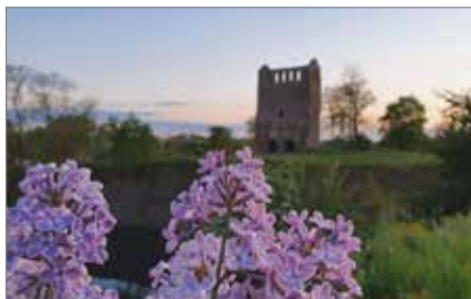
Die Ruine Nordhusen in Hundsburg

der Größe des Weißen Gartens die Kapazität begrenzt. Tickets gibt es im Vorverkauf für 10 Euro in der KulturFabrik und (je nach Verfügbarkeit) an der Abendkasse für 12 Euro. Ort: Weißer Garten, Bülstringer Straße 12, Haldensleben Einlass 19:00 Uhr, Beginn 20:00 Uhr