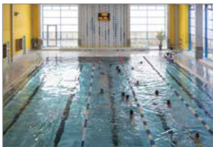
Rein ins Nass: Das Rolli-Bad ist beliebt bei Besuchern jeden Alters.

78.873 Gäste besuchten im vergangenen Jahr das Rolli-Bad, um im kühlen Nass ihre Bahnen zu ziehen, in der Saunalandschaft zu schwitzen oder um an den verschiedenen Kursangeboten teilzunehmen. Somit können die Stadtwerke Haldensleber als Betreiber der Schwimmhalle auf