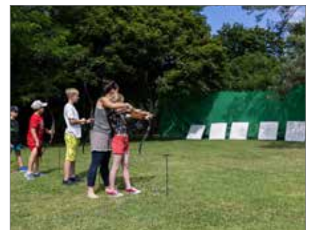
Spaß und Spiel bei der Stadtranderholung.