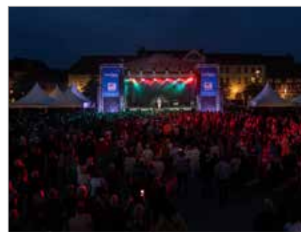
29. bis 31. August – Party und Stimmung beim Altstadtfest