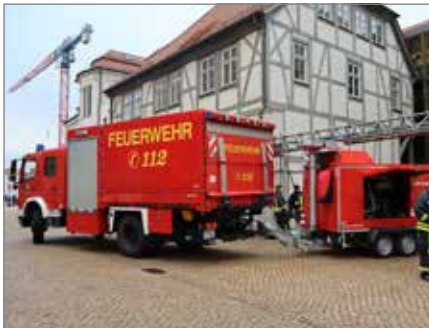
Der Test war erfolgreich und das Notstromaggregat ist einsatzbereit.

Gut vorbereitet für den Ernstfall: Die Stadt Haldensleben hat am 15. Januar eine Stromausfallübung am Rathaus durchgeführt. Wenn es zum Stromausfall kommt, soll ein Notstromaggregat dafür sorgen, dass wichtige Prozesse am Laufen gehalten werden. „Wir müssen sicherstellen, dass die Stadtverwaltung im Falle eines großflächigen Stromausfalls schnell wieder handlungsfähig ist“, erklärte Bürgermeister Bernhard Hieber. „Zudem ist das Rathaus dann eine wichtige Anlaufstelle für Bürger, die sich in