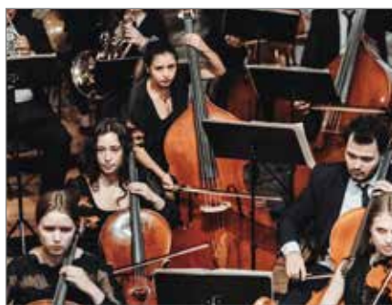
27. Juli bis 10. August – Klassische Melodien bei der Internationalen SommerMusikAkademie