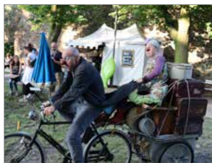
14. und 15. Juni – Clowns und Spaß beim Kunstfest „Spurensuche“