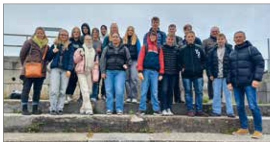
Jugendliche aus Haldensleben und den Ortsteilen erlebten ein spannendes Wochenende in Nürnberg.

Anfang November hatte die Stadt Haldensleben wieder interessierte Jugendliche eingeladen, auf geschichtliche Spurensuche zu gehen. Die Stadt Nürnberg wurde wie kaum eine andere zum Schauplatz des deutschen Nationalsozialismus. Am 4. November 2001 eröffnete