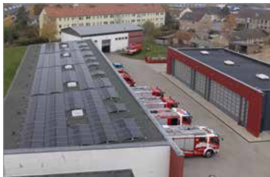
Blick auf das Dach der Freiwilligen Feuerwehr Haldensleben – hier wird jetzt Strom erzeugt.

Auf den Dächern der Jugendherberge und der Freiwilligen Feuerwehr in Haldensleben wurden Photovoltaikanlagen instal-