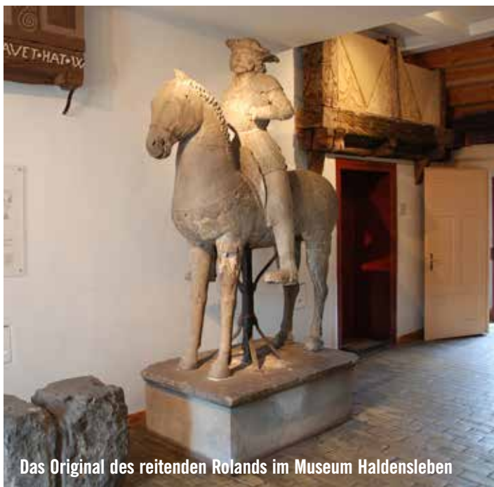
Das Original des reitenden Rolands im Museum Haldensleben