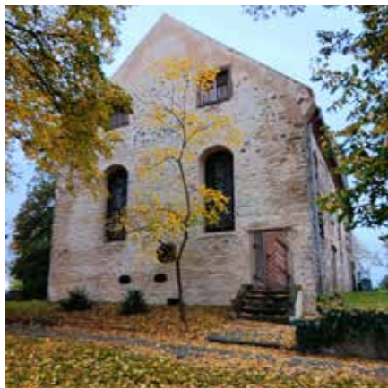
Die Treppe an der Patronatsloge an der St. Andreaskirche in Hundisburg bekommt zur Sicherung noch ein Geländer. Besucher können dann einen Blick in die Kirche werfen, auch wenn diese geschlossen ist.

„Die Anzahl der eingereichten Projekte und die gute Beteiligung bei der Online-Abstimmung ist überraschend und erfreulich“, kommentiert Bürgermeister Bernhard Hieber das Ergebnis.