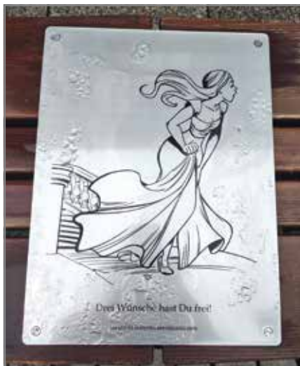
Eine der elf interaktiven Märchentafeln in der Hagenstraße

freigeschaltet, so dass es sich lohnt, wieder zu kommen.