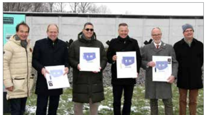
Die Host-Town-Partner hoffen auf viele Freiwillige für die Betreuung der Athletinnen und Athleten aus Singapur.

Momente gestaltet. Ausführliche Infos dazu gibt es auf www.haldensleben.de