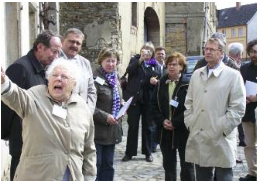
Besichtigungstour durch Hundisburg