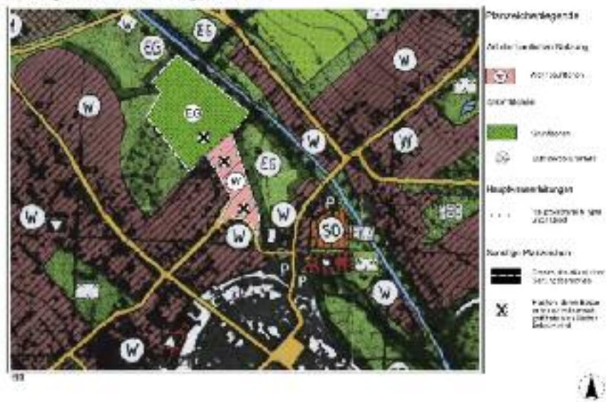
9. Änderung des wirksamen Flächennutzungsplans der Stadt

Planbereich der 9. Flächennutzungsplanänderung der Gemarkung Haldensleben mit der Darstellung der vorgenommenen Nutzungsänderungen