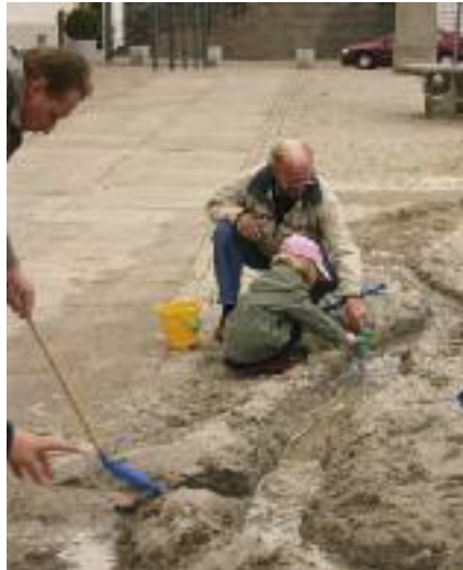
Eine Familien-Aktion: Sandburgenbau auf dem Marktplatz

puppte sich manches, was in Haldensleben bereits selbstverständlich ist, als durchaus nicht allgemein verbreitet: Die Entwicklung der Kindereinrichtungen